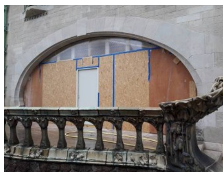
Avant / après : la destruction du bow window