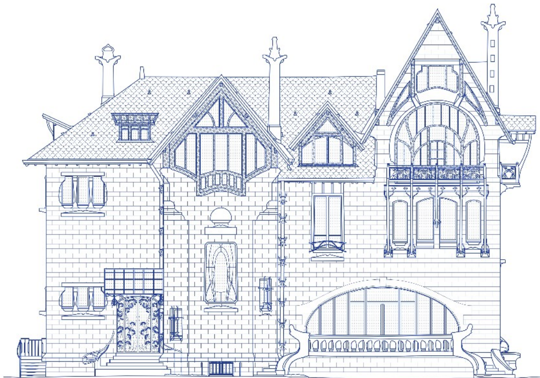
VILLA MAJORELLE NANCY